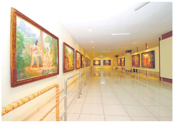
ભગવાન બુદ્ધનાં જીવનચિત્રો દર્શાવતી આર્ટ ગેલેરી